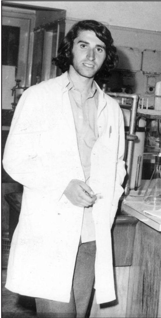
Στο εργαστήριο Αναλυτικής Χημείας, λίγες ημέρες πριν την εξέγερση του Πολυτεχνείου